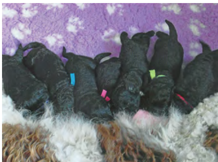
Outcross Wetterhûn met Labrador

Een soortgelijke poging doet zich voor bij de Stabijhûnen. Leden die het hier niet mee eens zijn, vormen de vereniging 'De Stabijhoun' en 'Wetterhoun-vereniging Nederland'.