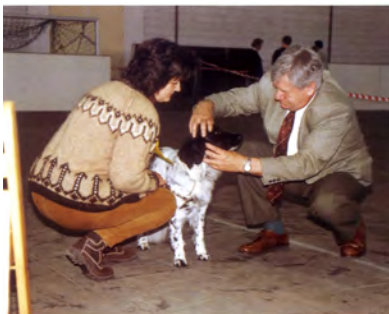
Een clubmatch in Hoogeveen in 1991

De Vereniging stelt zich ten doel de beide hondenrassen in stand te houden. De belangstellenden in die rassen worden, via het lidmaatschap, beter bij elkaar gebracht, de liefhebberij in het fokken wordt zo bevorderd. Het uiteindelijke doel is dat vitale stabij- en wetterhûnen met een goed karakter, een goed exterieur en een goede gezondheid in een geschikt milieu worden geplaatst.