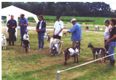
De keuring in Harkema in 2003

In het stamboek staan alle goedgekeurde (dus rastypische) dieren geregistreerd. Een foktechnische commissie geeft adviezen over welke kruisingen (om inteelt te voorkomen) toegestaan zijn. Ieder jaar worden keuringen van de landgeiten georganiseerd. De dieren worden bekeken op raskenmerken waarbij