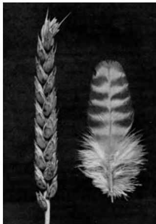
Tarweaar en veer van de gepelde Friese hoenderrassen

De kleurslagen worden zowel bij de gewone Friese hoenders als bij de krielvariant van die hoenders aangetroffen.