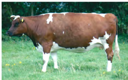
Friese Roodbonte koe

De door de Stichting geregistreerde roodbonte runderen zijn het resultaat van het kruisen van twee zwartbonten met een roodfactor. Daarnaast is er de roodbonte Friese koe die de invloed van het zwartbonte Fries-Hollandse ras niet heeft ondergaan. Beide varianten zijn moeilijk te (onder)scheiden.